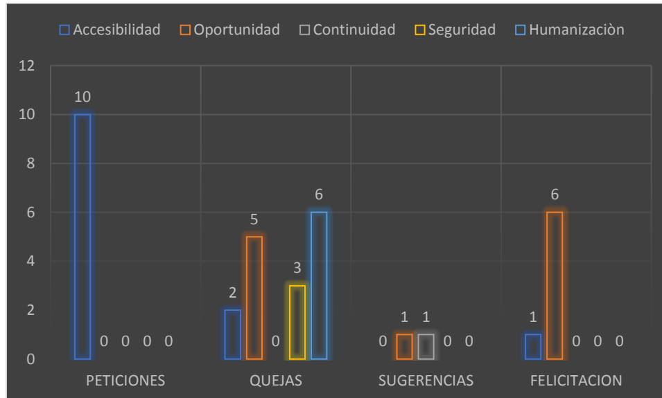
Gráfico 3. Durante el mes de Septiembre se evidencia mayor mecanismo de participación escrita por medio de las peticiones las cuales hacen referencia a la solicitud de información. De igual forma la queja siendo esta una manifestación verbal o escrita de insatisfacción hecha por una persona natural o jurídica con respecto a la conducta o actuar de un funcionario de la entidad en desarrollo de sus funciones.

Con respecto a los indicadores de calidad se puede evidenciar que el indicador de Accesibilidad presento 10 peticiones las cuales hacen referencia a la solicitud de información frente a validación de incapacidades y solicitud de historias clínicas.